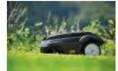
Mowit mit fachm. Installation

Ihr Fachhändler vor Ort, fragen lohnt sich!